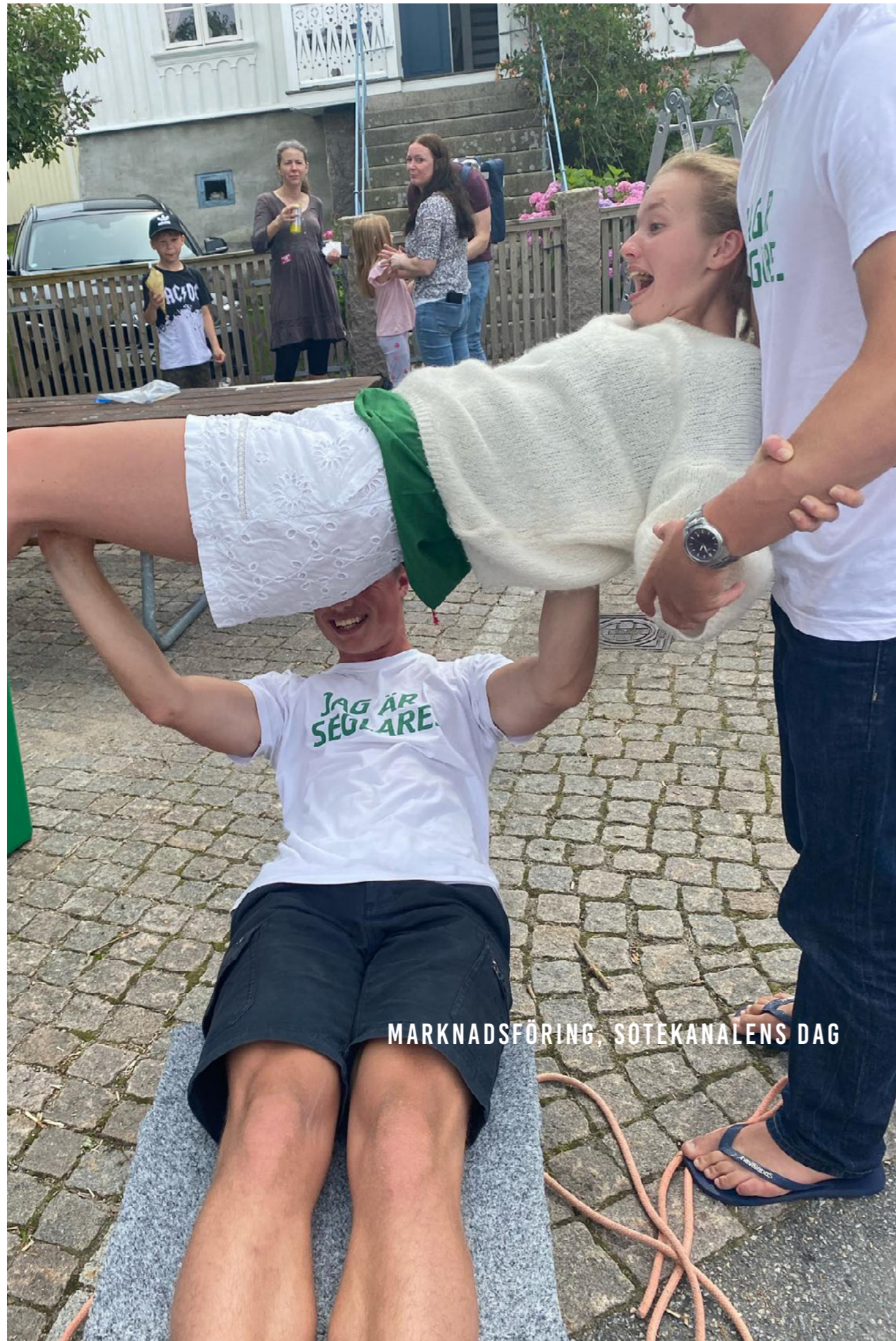
MARKNADSFÖRING, SOTEKANALENS DAG